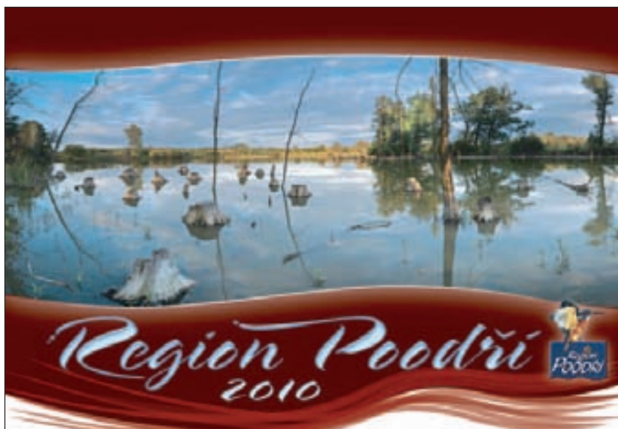
Region Poodří vydal nástěnný kalendář 2010. Na fotografii je titulní stránka kalendáře.

Návštěvníci mají možnost navštívit i zajímavosti jednotlivých měst. Bílovec nabízí městské šachy na ploše historického náměstí a okolí jako stvořené pro pohodovou cykloturistiku, Fulnek památník učitele národů – Jana Ámose Komenského, Odry kompletně zrekonstruované koupaliště s tobogánem naučnou stezkou Stříbrný chodník a Studénka jedinečné Vagonářské muzeum.